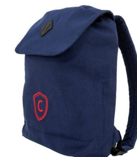
BACKPACK CITROËN COLLECTION C