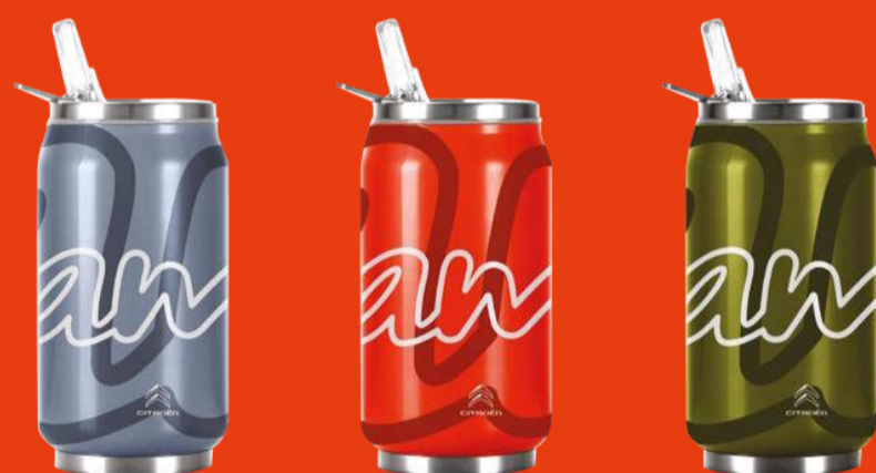
ΙΣΟΘΕΡΜΙΚΟ ΜΠΟΥΚΑΛΙ CAN'IT