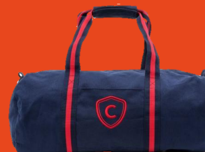
ΣΑΚΙΔΙΟ ΤΑΞΙΔΙΟΥ CITROËN COLLECTION C