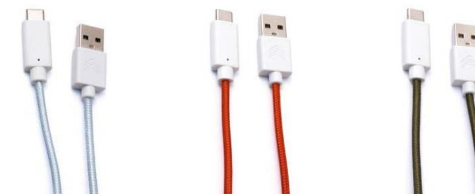
ΚΑΛΩΔΙΟ ΦΟΡΤΙΣΗΣ SMARTPHONE (TYPE C / iOS)