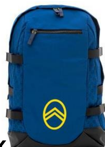
BACKPACK CITROËN MONOGRAM