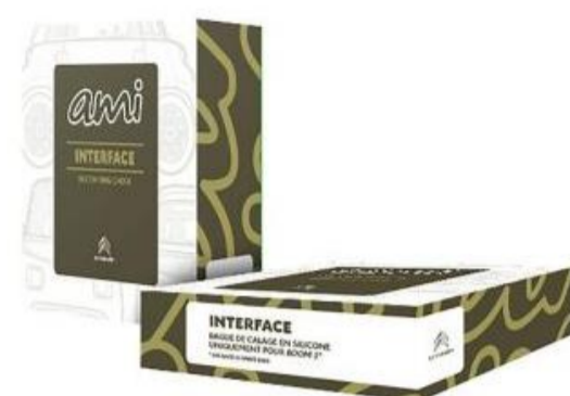
ΒΑΣΗ ΣΤΗΡΙΞΗΣ ΗΧΕΙΟΥ BLUETOOTH