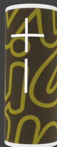
ΗΧΕΙΟ BLUETOOTH ULTIMATE EARS BOOM