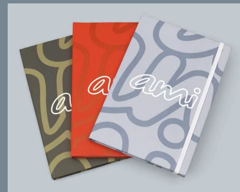
ΣΗΜΕΙΩΜΑΤΑΡΙΟ Διαθέσιμο σε 3 χρώματα