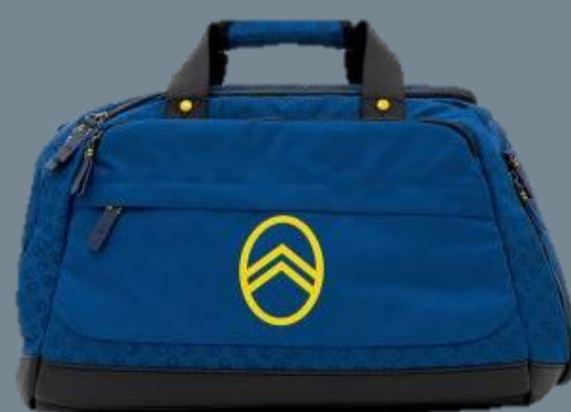
ΣΑΚΙΔΙΟ ΤΑΞΙΔΙΟΥ CITROËN MONOGRAM